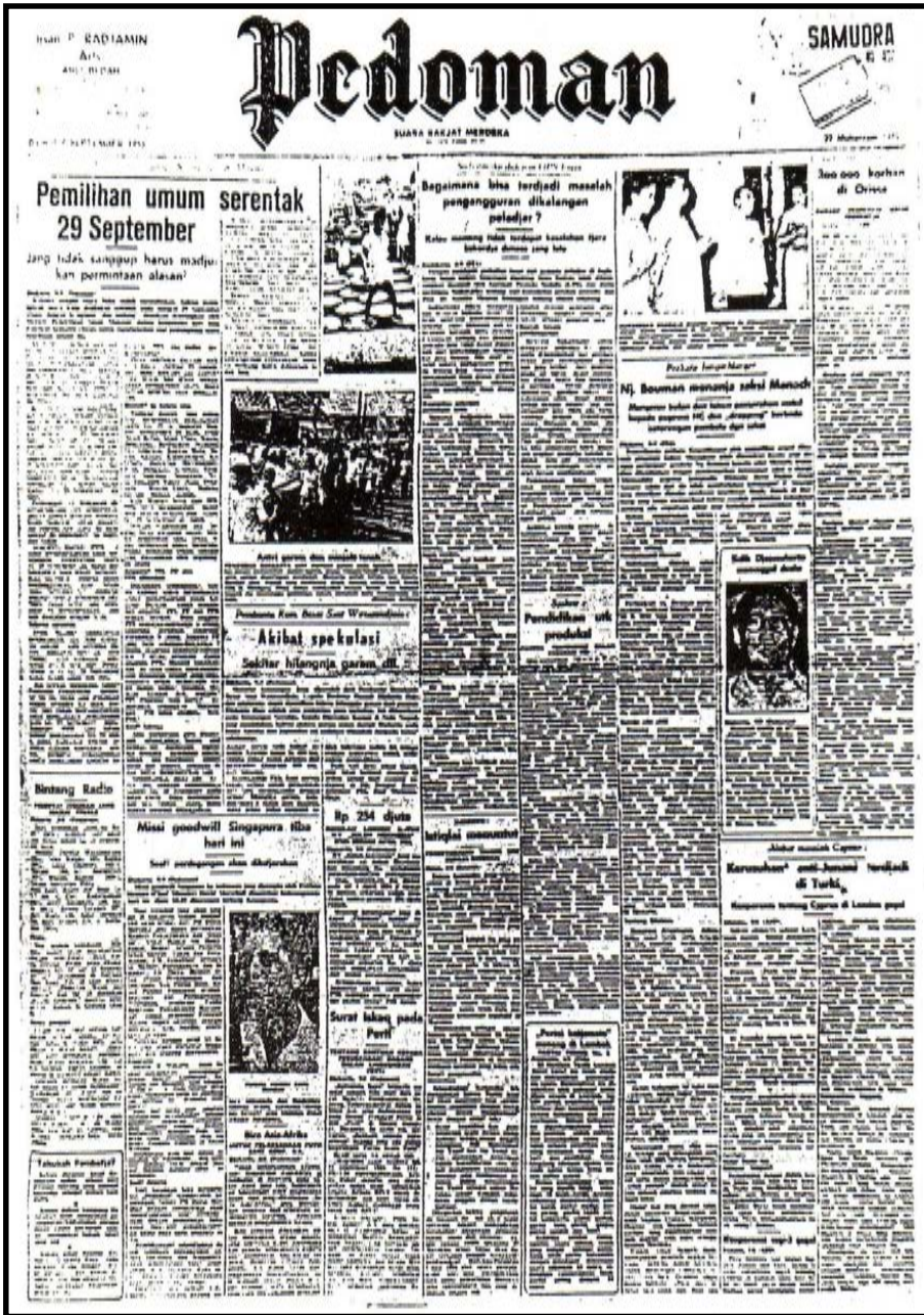
Gambar 1 Surat kabar Pedoman (Jakarta), pimpinan Rosihan Anwar, edisi 9 September 1955 yang memberitakan tentang Pemilihan Umum 1955. (Sumber: Said ed., 1992:108)