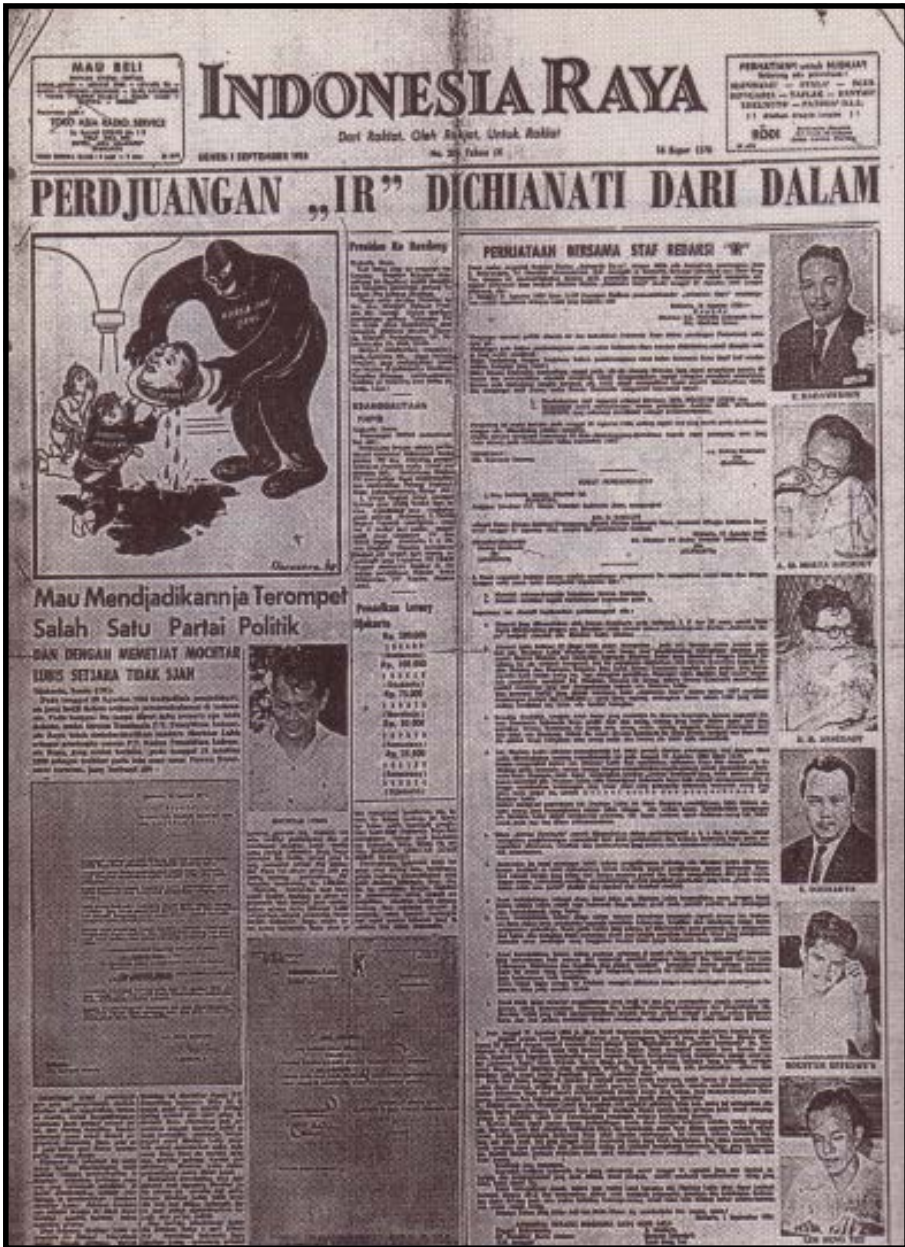
Gambar 4 Surat kabar Indonesia Raya (Jakarta), pimpinan Mochtar Lubis, edisi 1 September 1958 yang menunjukkan bahwa “pers jihad” ini akan segera mengakhiri hidupnya pada akhir tahun 1950-an karena konflik internal dan tekanan penguasa.