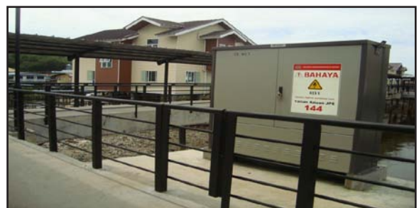
Gambar 20: Bekalan Elektrik di Kawasan Projek Perintis Menaik Taraf Kampong Ayer