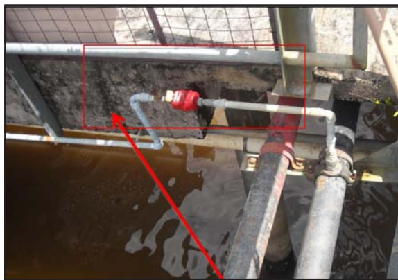
Meter Ayer Gambar 2: Bekalan Air Paip Bersih dan Meter Air