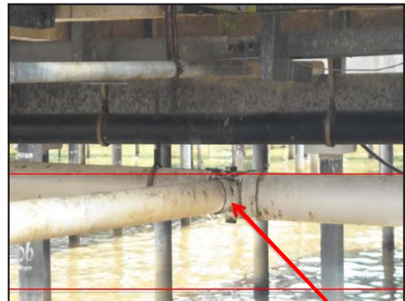
Saluran Najis Gambar 6: Saluran Najis di Bawah Jambatan Konkrit

angin, astro, periuk elektrik, peti sejuk, dapur ketuhar elektrik, cerek elektrik, mesin basuh, dan peralatan elektrik yang lain.