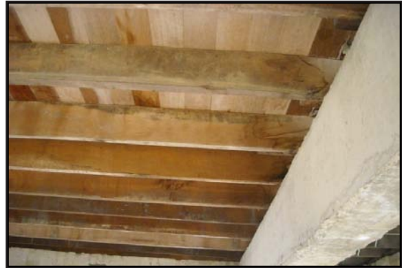
Gambar 10: Lantai Rumah Diperbuat daripada Papan.