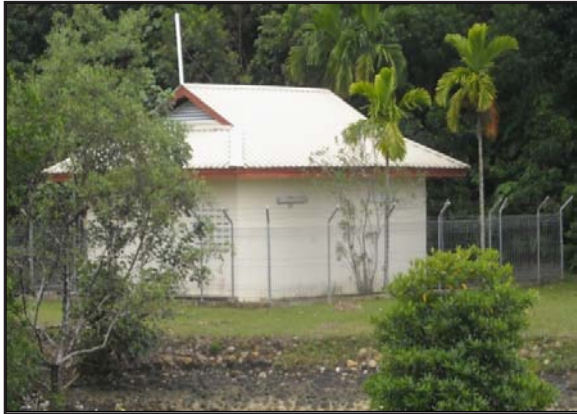
Gambar 7: Tempat Pembuangan Najis