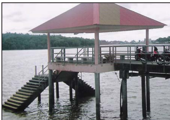
Gambar 3: Kemudahan Jeti untuk Menunggu Perahu Tambang di Kampung Bolkihah