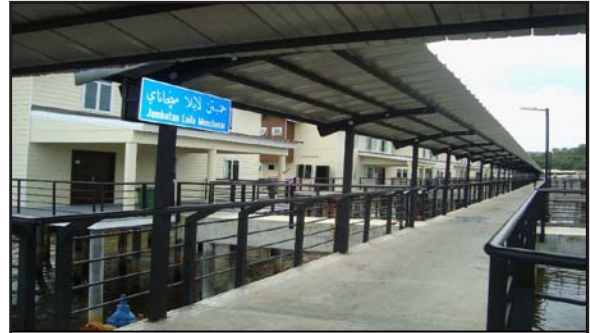
Gambar 17: Jejantas Berlantaikan Konkrit Menuju ke Rumah-rumah, dengan Nama Jejantas "Jambatan Lela Mencanai"