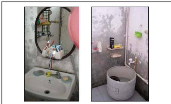
Gambar 14: Bilik Mandi