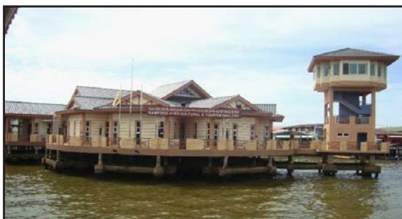
Gambar 16: Galeri Kebudayaan dan Pelancongan Kampong Ayer