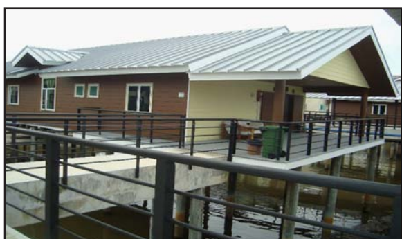
Gambar 23: Rumah Setingkat Berbentuk Belah Bubung Moden