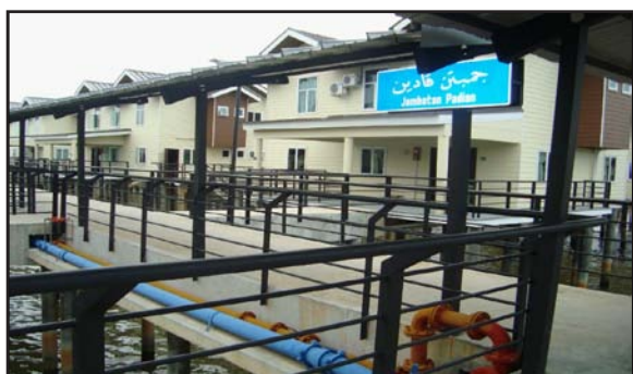
Gambar 24: Nama Jejantas "Jambatan Padian"

daripada papan (sila lihat gambar 10). Gelegar atau beam rumah diperbuat daripada simen konkrit (sila lihat gambar 11). Tiang rumah diperbuat dari simen yang di cerucuk (sila lihat gambar 12). Tandas dalam rumah diperbuat dari simen konkrit. Lantai dan dinding tandas dibuat dari simen konkrit (sila lihat gambar 13 dan gambar 14).