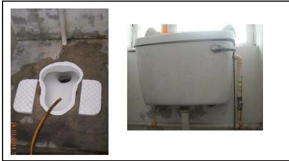
Gambar 13 : Tandas di Rumah Kampong Bolkiah Diperbuat dari Simen Konkrit