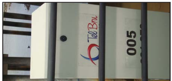
Gambar 19: Kemudahan Disediakan dari TelBru (Telekom Brunei)