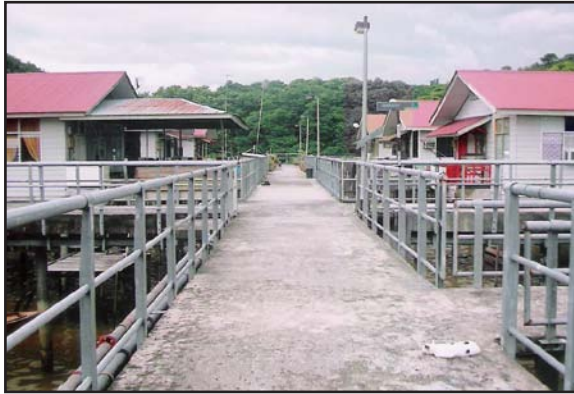
Gambar 1: Kemudahan Jambatan di Kampung Bolkihah