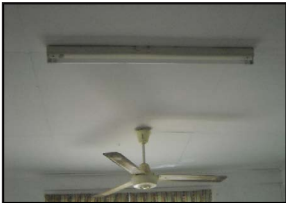
Gambar 8: Kemudahan Elektrik, Kipas Angin, dan Lampu