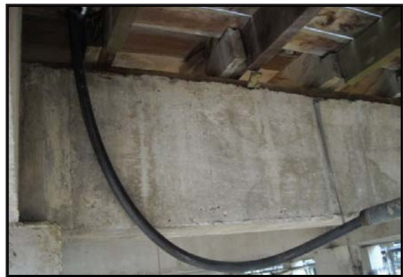
Gambar 11: Gelagar atau Beam Rumah Diperbuat daripada Simen Konkrit