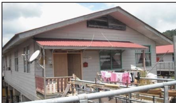
Gambar 15: Di Hadapan Rumah