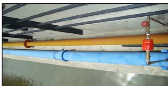
Gambar 22: Kemudahan Paip Air dan Meter Air bagi Setiap Rumah