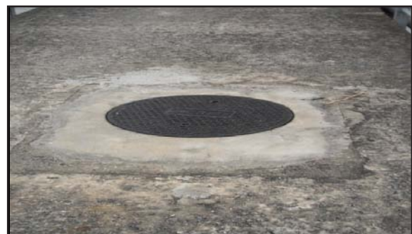
Gambar 5: Sistem Pembuangan Najis yang Menggunakan Sistem Inovatif Jenis Vakum