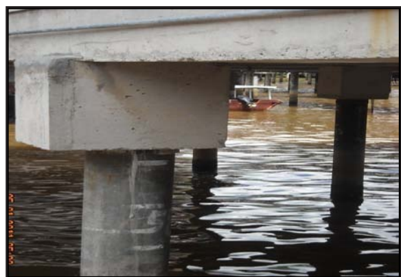
Gambar 12: Tiang Rumah Diperbuat dari Simen yang Dicerucuk

Kampong Bolkiah A dan Kampong Bolkiah B, pada mulanya, diperbuat dari atap asbestos, namun pada masa ini atap rumah tersebut telah digantikan dengan atap zink jenis spandix yang berkualiti. Ini disebabkan atap asbestos dipercayai kurang baik dari