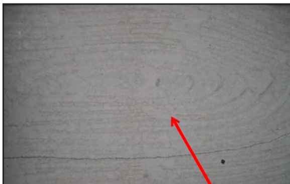
Dinding Rumah Jenis Cement Board