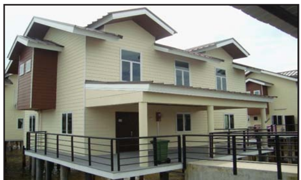
Gambar 18: Rumah Dua Tingkat Moden