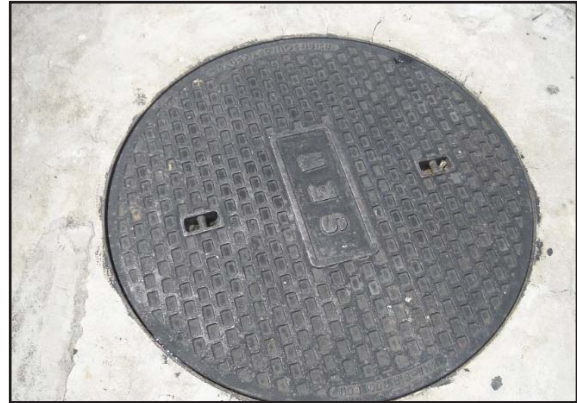
Gambar 4: Septic Tank Saluran Najis