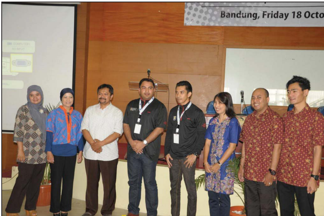
Kepentingan Pembangunan Sumber Manusia

Dalam konteks pembangunan sumber manusia, pembentukan budaya organisasi yang dikehendaki oleh sesebuah organisasi itu amat penting, memandangkan pekerja belajar secara tidak formal melalui pengalaman dan pemerhatian. Budaya kerja dan budaya organisasi yang cemerlang dapat membentuk pekerja yang cemerlang. Peranan organisasi dalam membangun sumber atau potensi yang ada dalam setiap pekerja dilihat semakin mencabar dalam dekad ini.